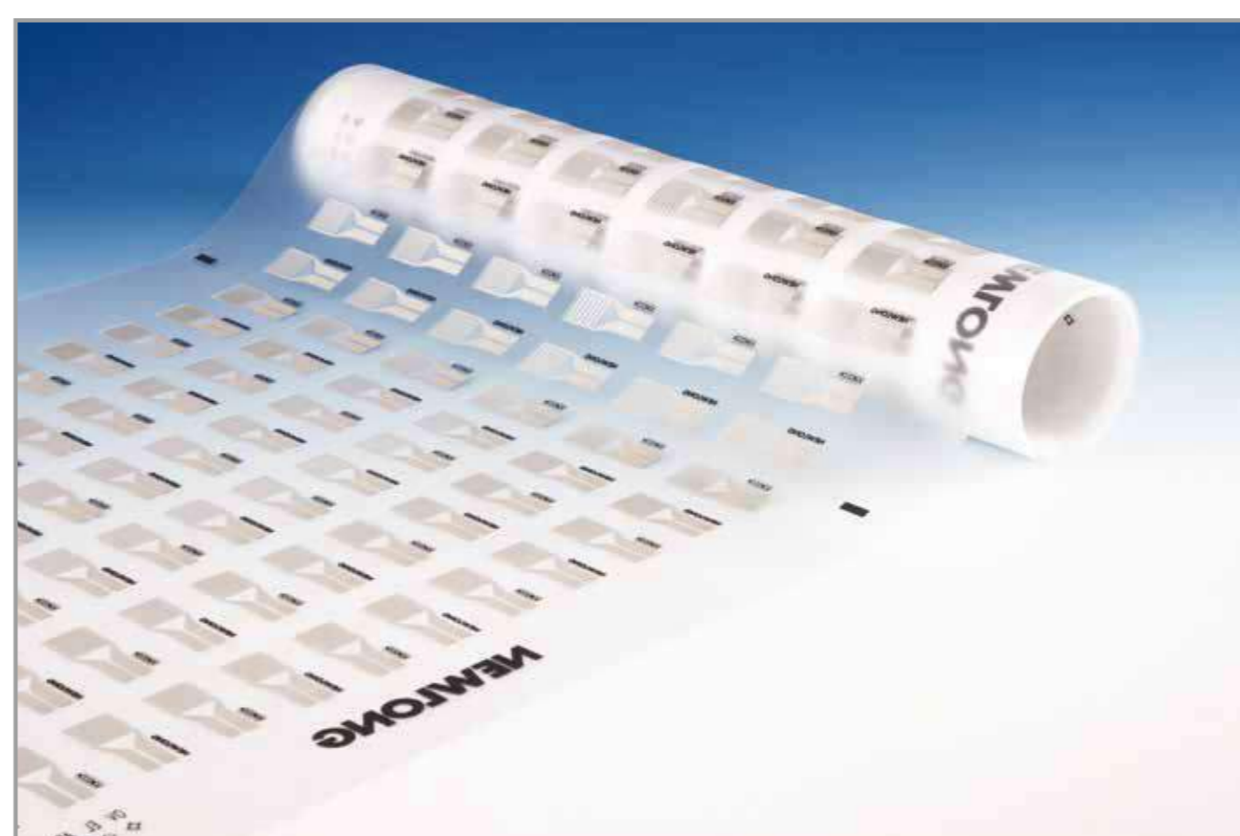
図. ウェアラブルセンサパターン/LS-500NRで印刷