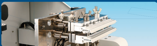
DP-320S 専用スキージヘッド