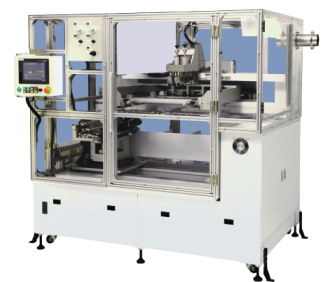
出展装置：曲面印刷機（参考）