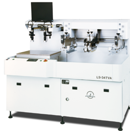
出展装置：LS-34TVA 印刷面積(mm):300×400以内 版枠サイズ(mm):550×650/650×750/750×750